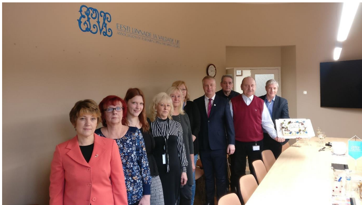
27.02.2019 sai Eesti Linnade ja Valdade Liit 1 aastaseks

Liidu asutamise ja tegevuse erisused seadustab kohaliku omavalitsuse üksuste liitude seadus (KOLS), mille alusel sätestatakse liidu põhikirjas liidu organid ja nende organite volitused. ELVL volikogus on esindatud kõik Linnade ja Valdade Liidu liikmed, mis tagab volikogule üldkoosoleku pädevuse MTÜS § 18 ja KOLS § 7 lg 1 mõistes.