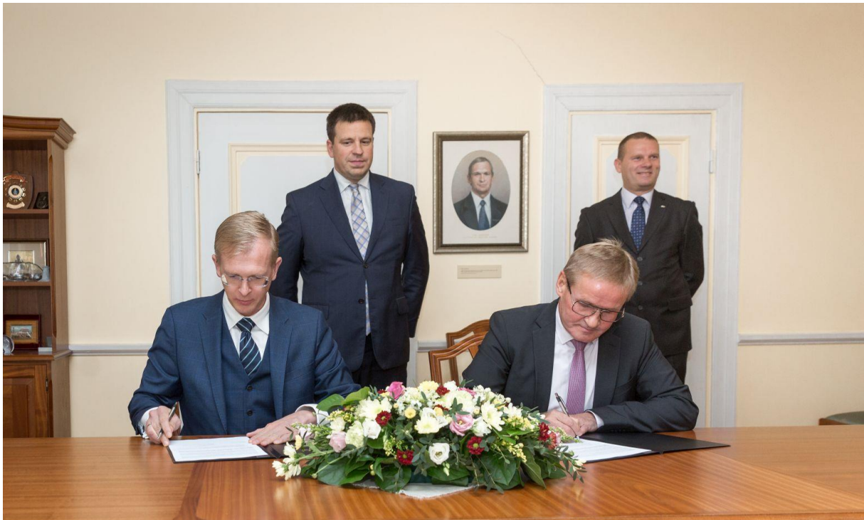
Vabariigi Valitsuse ning Eesti Linnade ja Valdade Liidu eelarveläbirääkimiste protokollile allkirjastamine 20. septembril Pärnus. Allkirjastajad vasakult: Tiit Terik, ELVL juhatuse esimees; Jaak Aab, riigihalduse minister.