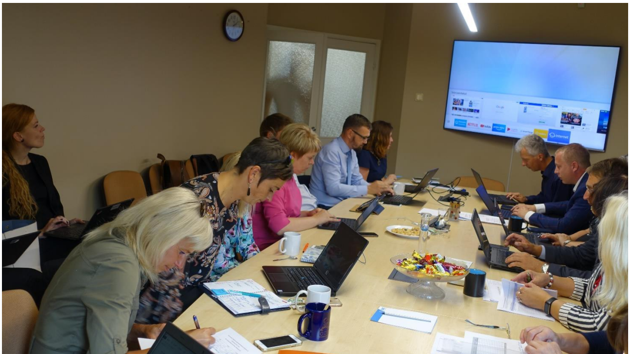
Töö-, sotsiaal- ja tervise töörühma koosolek ELVL büros 10.09.2019